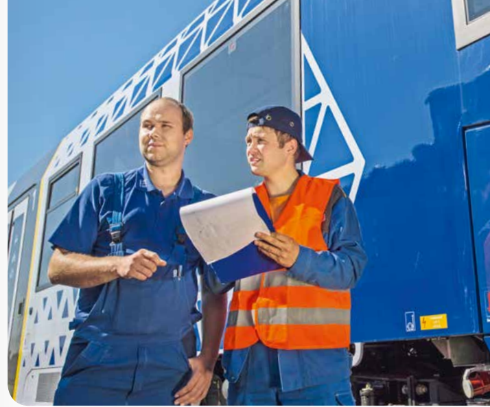
Mit Sicherheit ein Job mit Verantwortung.