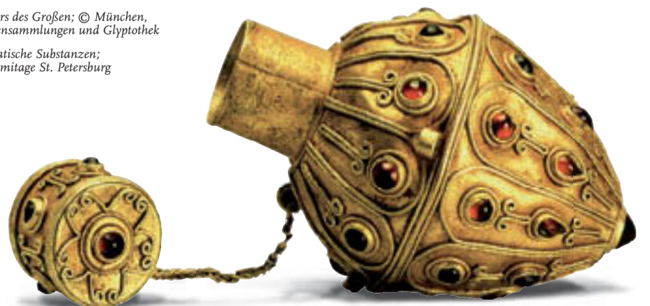
Flakon für aromatische Substanzen